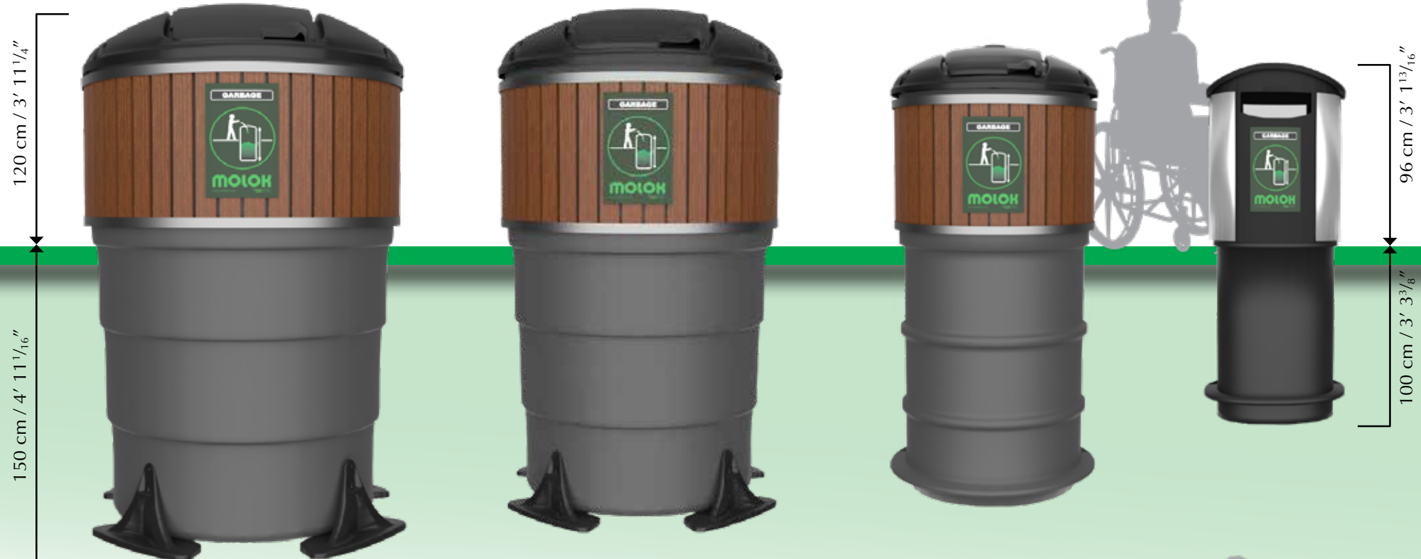
M-5000 avec le sac souple de levage pour les déchets peu liquide