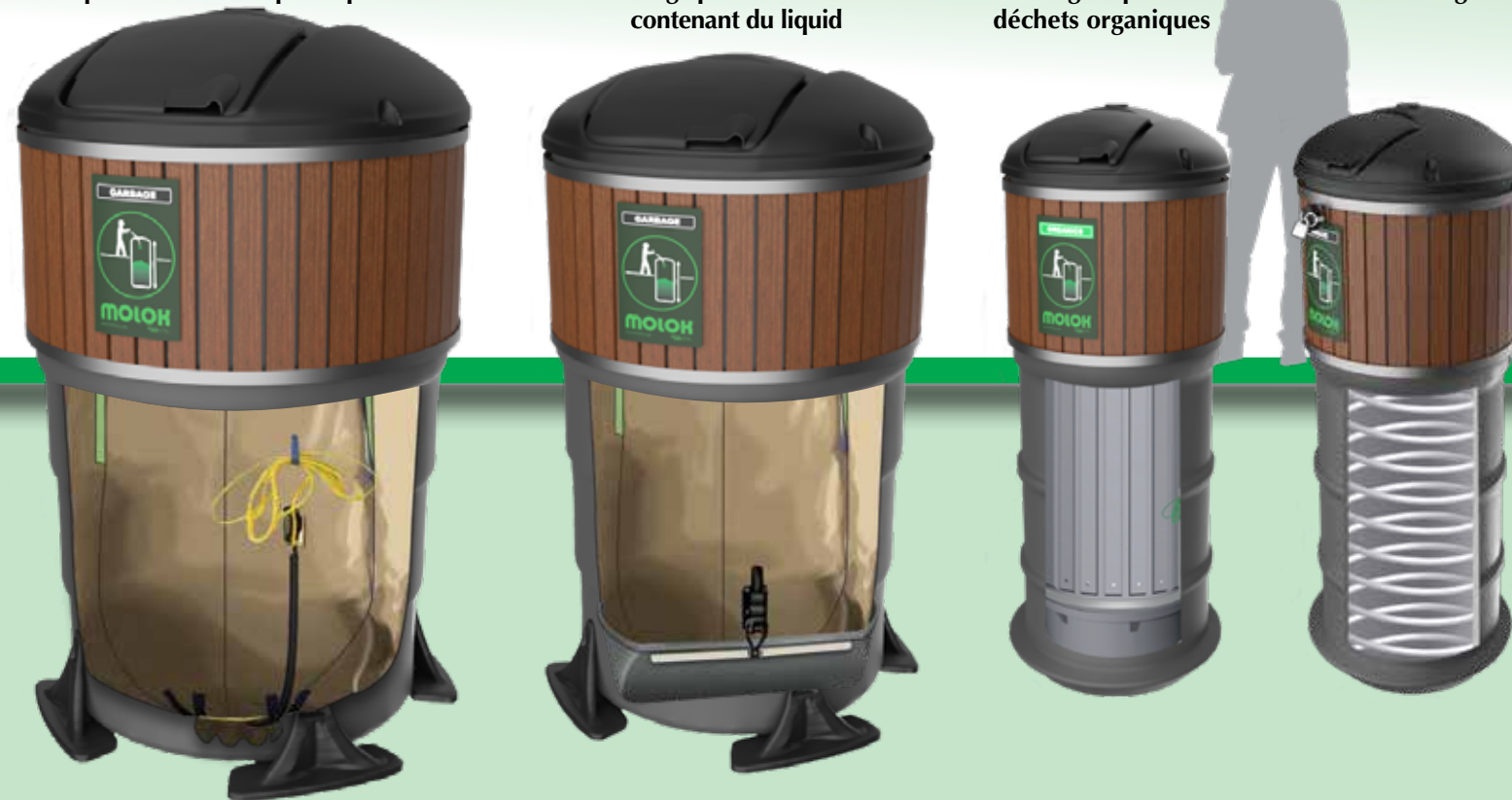
M-Grease™ pour les huiles usagées

Choisissez la taille, le couvercle et la finition qui vous convient le mieux. La taille des conteneurs Molok® va de 0,4 à 6,5 verges 3 (300 à 5000 litres). Que vous collectiez des déchets dans une aire de repos peu achalandée ou un restaurant très fréquenté, Molok® offre une solution à tous vos besoins de gestion des matières résiduelle.